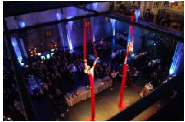
STEVIGE BALKEN AAN HET PLAFOND